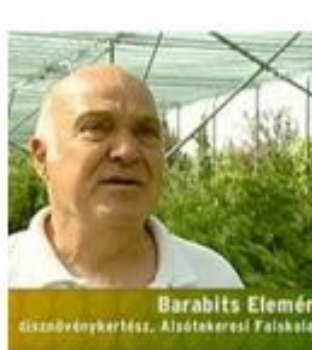
Barabits Elemér Giszabénykertész, Alótakarcsi Faiskola